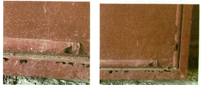
Foto 6: Mantenimiento a estructura (lijado, cambio de tubo, etc.)

Observación: Si es necesario se pueden agregar hojas adicionales y registrar el número de hojas.