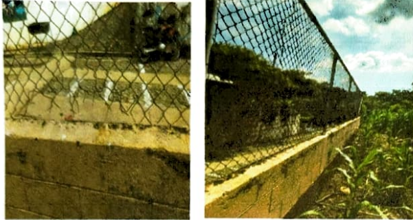
Foto1: Sustitución de barandas de metal.